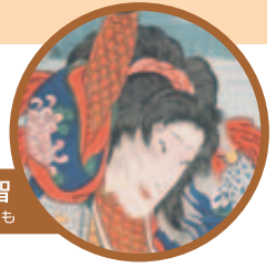
犬坂毛野胤智 いぬさかへの たねとも

早春の南房総で、花摘みといちご狩り体験!心やすらぐ海と花景色を楽しむ花街街道を走って、「香り」に包まれる旅を。菜の花に、キンセンカ、ストック、キンギョソウなど春の花満開です。