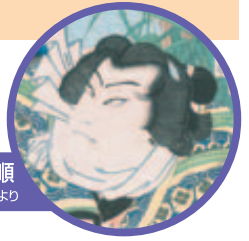
犬田小文吾悌順 いぬたこぶんこ やすより

花満開の癒し空間とのんびり、湯ったり。日帰り温泉でくつろぎの一時を過ごしたい、リフレッシュしたいというあなたへ。仲間と家族で、温泉巡りも楽しい旅。